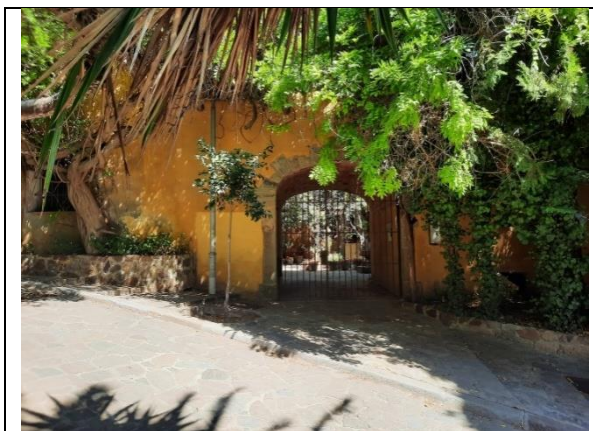
Imatge actual de l'antic carreró que duia a l'antic cementiri parroquial i a l'església. Sempre es mantingué buit i net fins a finals dels anys 70.

marxar per ubicar-se a la Carretera d'Esplugues, al barri de Pedralbes de Barcelona. Poc després la va comprar en Xavier Corberó. Avui en dia aquesta escola es troba a la Plaça d'Espanya de Barcelona.