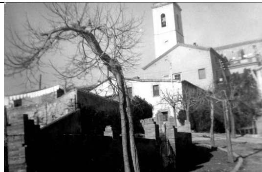
Dècada dels anys 60. Can Cargol, la rectoria i la parròquia d'Esplugues. Les cases no tenien enfiladisses per les parets. A la dreta el carreró tancat que duia a l'antiga església i cementiri parroquial. AMEL. Reg 4048. Col·lecció L'Abans, cedida per Antonio Fuentes. Autoria desconeguda.

Però un bon dia aparegueren uns càrrecs tècnics de l'Ajuntament a fer una inspecció de la casa pairal. Després de fer la inspecció, els comunicaren a les meves tietes que la teulada de la casa estava en perill d'esfondrar-se i la casa amenaçava ruïna. Ells eren conscients que les obres eren molt cares i que eren coneixedors de la greu situació econòmica que patia la família. Però ells