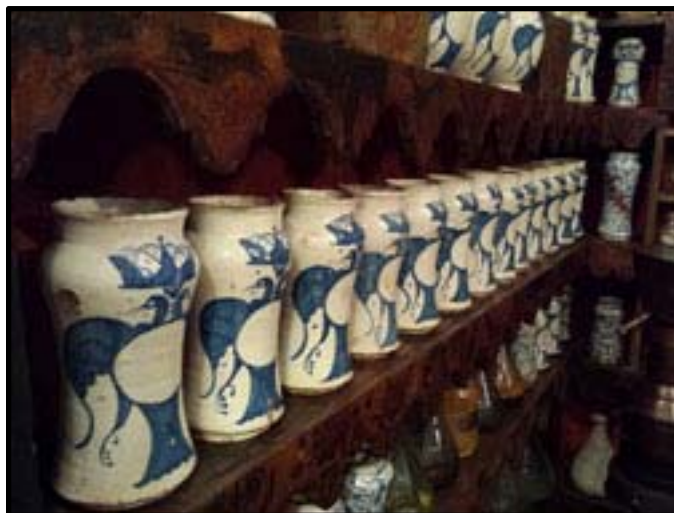
Antics pots de farmàcia de ceràmica.