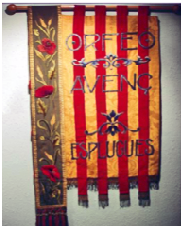
Estendard de l'Orfeó de l'Avenç

Al capdavant, no pot ser més honorosa l'actitud d'honorar aquells ciutadans que van fer de la seva vida un testimoni de ciutadania i de catalanitat. És així com sobreviuen els pobles.