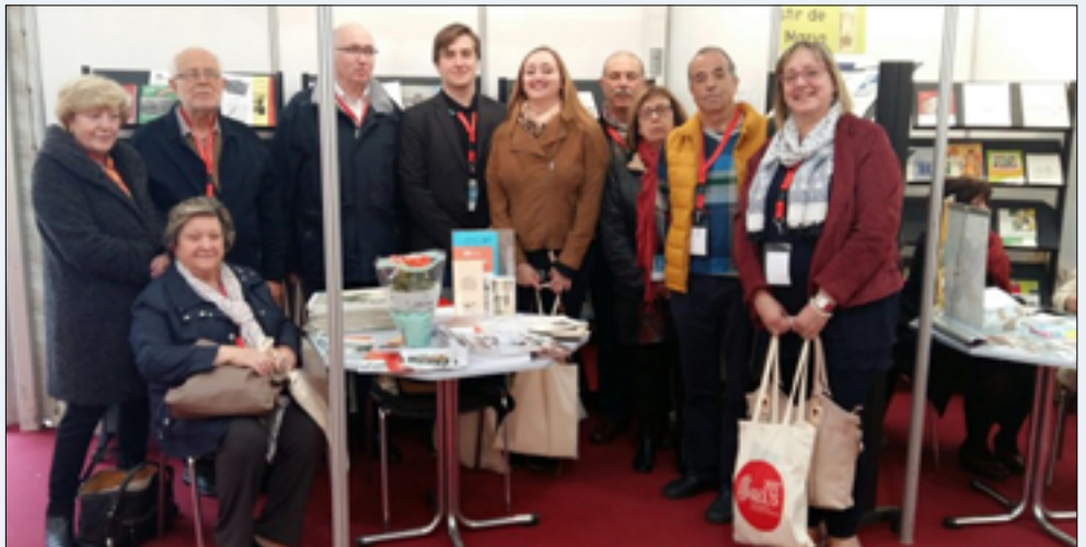
2017. Recercat a Reus

Les relacions entre el món local i el món universitari és molt ampla i profunda, potser un dels motius que han dut a aquest distanciament sigui la competència entre universitats a nivell internacional i els òrgans de govern de les universitats han incentivat polítiques per a estar en els llocs més elevats dels rànquings que les qualifiquen. I el que es quantifica és l'impacte dels treballs acadèmics registrats en aquests llistats, és a dir quantes vegades són citats els autors dels articles i això fa que els òrgans de govern de les universitats