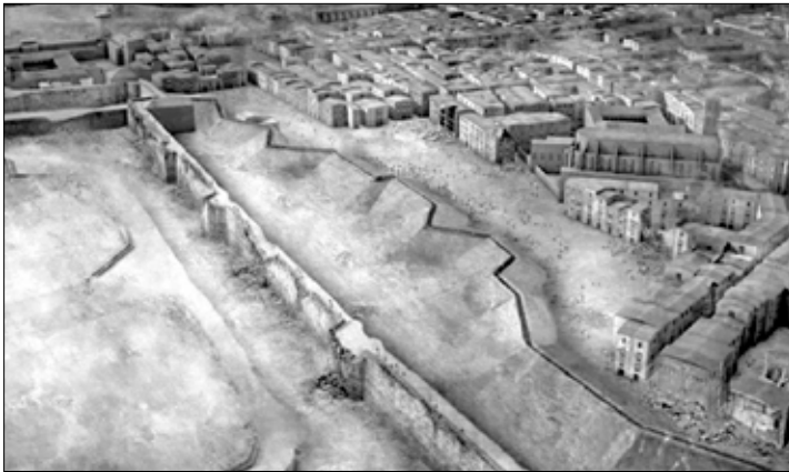
1714- El setge a Brcelona