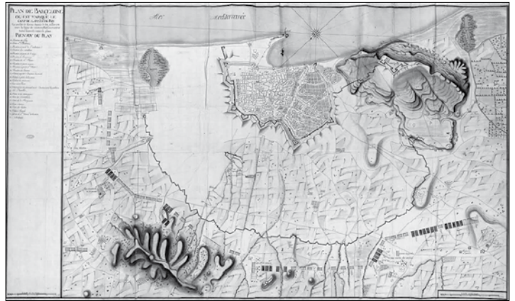
Disposició forces felipistes durant el setge