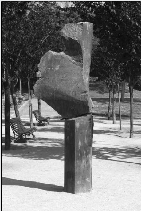
El Samurai. Escultura de X. Corberó.