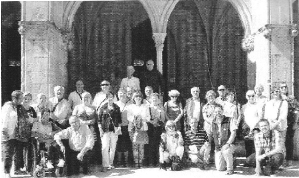
Visita al Born dels socis i amics del Grup d'Estudis d'Esplugues, el passat 27 de setembre

La segona va ser la Memòria i evolució dels casaments a Esplugues. Recull de 1867 a 1960 , publicada també en col·laboració amb l'Ajuntament l'any 2003. Es tracta d'un estudi sobre l'evolució de la vida quotidiana centrada en els casaments i que es va materialitzar en una exposició i en el llibre.