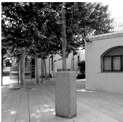
Vista després de la substracció