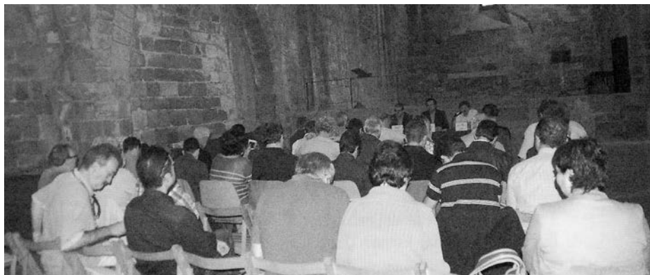
Primera trobada de Centres d'Estudis del Camp de Tarragona, la Conca de Barberà i el Priorat. Escornalbou, 6 d'octubre de 2012.

Quan aquesta coneixença es refereix al territori que, en el nostre cas, és el que abasta tots els països de parla catalana, creix en nosaltres una sensació d'arrelament i estima, que voldríem encomanar a tota la nostra ciutadania. En això rau el fonament de les trobades territorials, quan els centres d'estudi que hi participen reconeixen la plenitud que comporten uns coneixements que abans ignoràvem i que ajuden a dinamitzar aquesta potent eina cultural. En efecte, l'adquisició, transmissió i compartició de coneixements ens fa sentir més integrats en el nostre país que s'expressa en una progressiva conscienciació social.