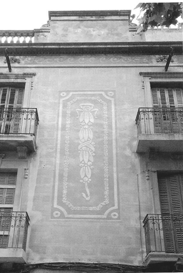
Plaça Santa Magdalena