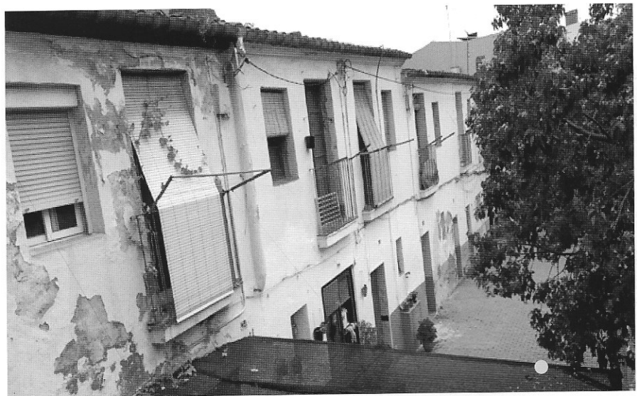
carrer Sant Llorenç.

Si voleu, podeu enviar o publicar a les xarxes del Grup d'Estudis o de la Crònica de la Vida d'Esplugues, fotografies d'espais, de racons o detalls d'aquest itinerari, que plegats compartirem i gaudirem.