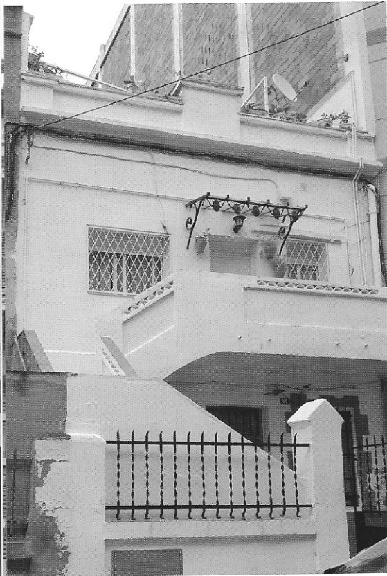
carrer Pau Torres